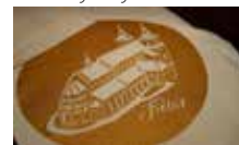
▲ Výtisk motivu na tašku