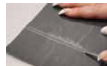
▲ Linoryt - rydlo