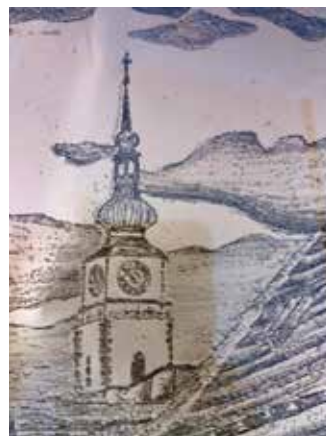
▲ Domácí litografie ▼ Suchá jehla ▶