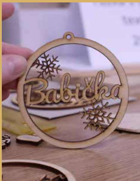
Laserový gravírovací stroj